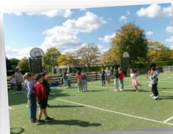
CE1/CE2 en EPS avec Mme Rétif