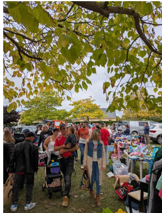
Association Val' en fête